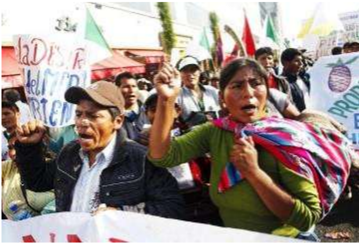
Protesta contra la minería en Puno

El dirigente aymara se mostró indignado frente a este intento de detención: “Yo no soy delincuente. Defender los recursos naturales no es ser delincuente, eso que quede claro, esto es un abuso de autoridad, a nosotros no nos han notificado nada.” También otros dirigentes, como los alcaldes de Yunguyo y Chucuito y varios consejeros regionales, corren el riesgo de enfrentar juicios por los hechos ocurridos.